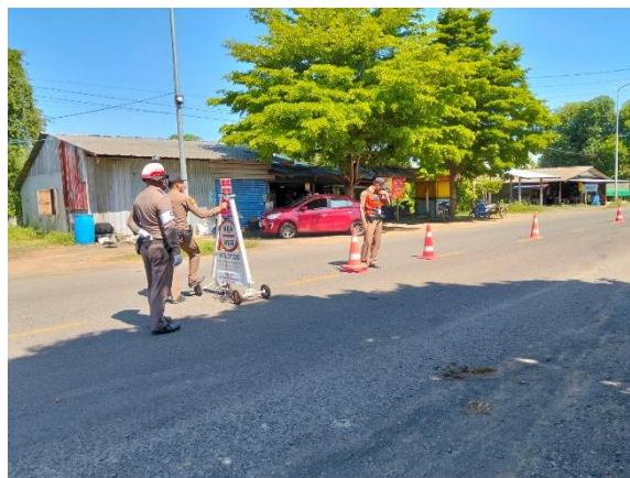
ภาพการตั้งจุดตรวจกวดขันวินัยจราจร