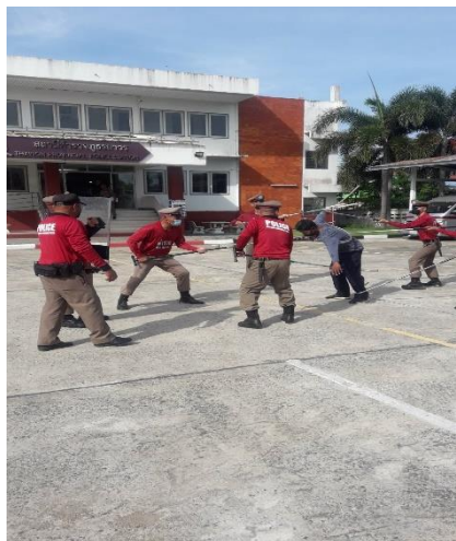
จัดทำกรฝึกตามระเบียบ ตร. และฝึกยุทธวิธี ทุกวันพุธ ของสัปดาห์ เวลา ๐๙.๐๐ น.